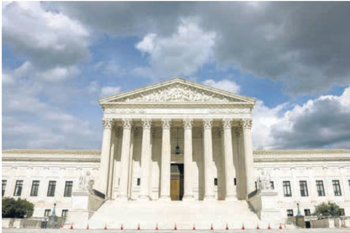
La Corte Suprema estudiará las restricciones a la mifepristona.

El magistrado retiró la autorización para comercializar una de las píldoras abortivas más usadas. Gobierno y laboratorio apelaron.