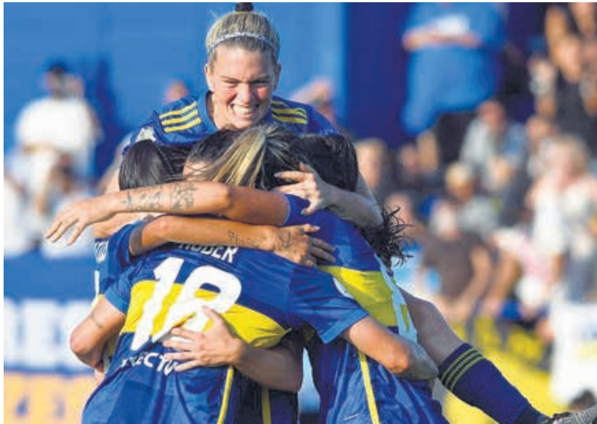
Las chicas de Boca, de festejo.

El partido de vuelta terminó 2-0 y, con un global de 3-0, sumó su 28vo título, el quinto en el profesionalismo para las mujeres.