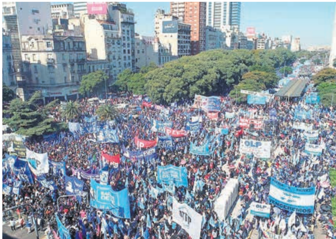
“Las medidas nos llevarán a una situación castastrófica”, dicen desde las organizaciones.

Las organizaciones sostienen que el aumento de la AUH y Alimentar “no alcanza” y denuncian la “licuación” del Potenciar.