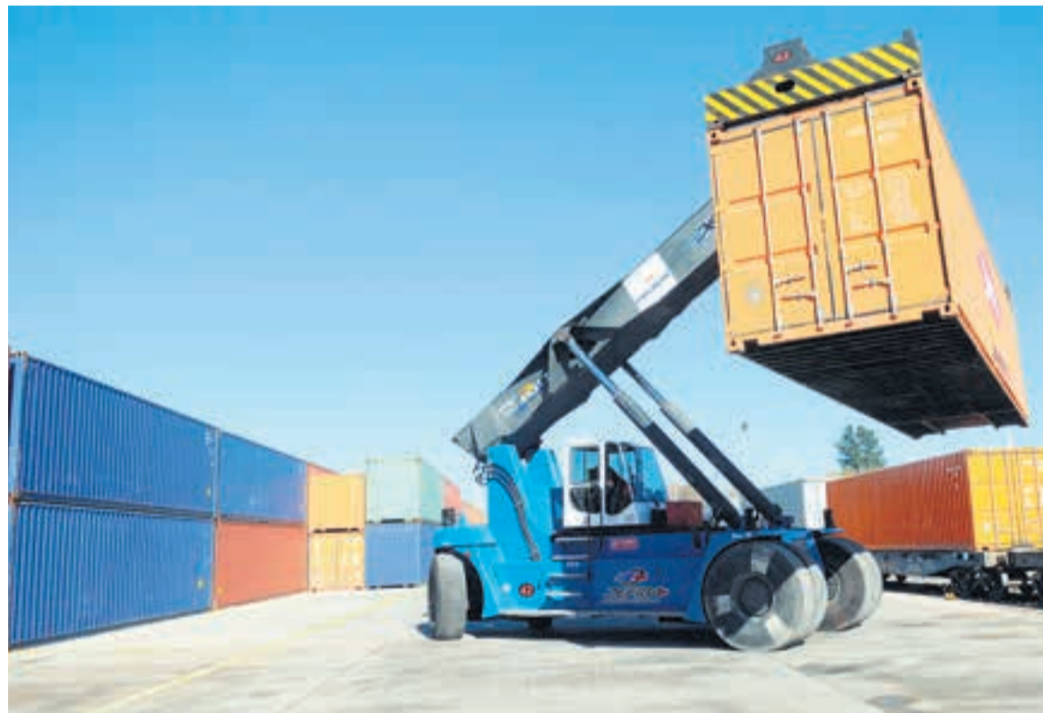
Los bonos serán para importadores que financiaron sus compras en el exterior.

El BCRA lanzará bonos para los importadores de bienes y servicios con deuda comercial que se encuentre pendiente de pago.