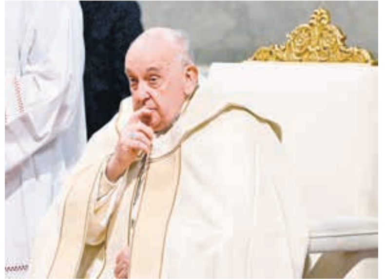
Francisco celebra misa en la Basílica de San Pedro en el Vaticano.

En ese sentido, el pontífice indicó que visitará Bélgica el año próximo y que tiene pendiente venir a Argentina. "hay dos claros pendientes, uno a la Polinesia y otro a Argentina, que están ahí pendientes. Veremos cómo se da la cosa, pero con el tiempo voy a ir retomando las cosas", explicó.