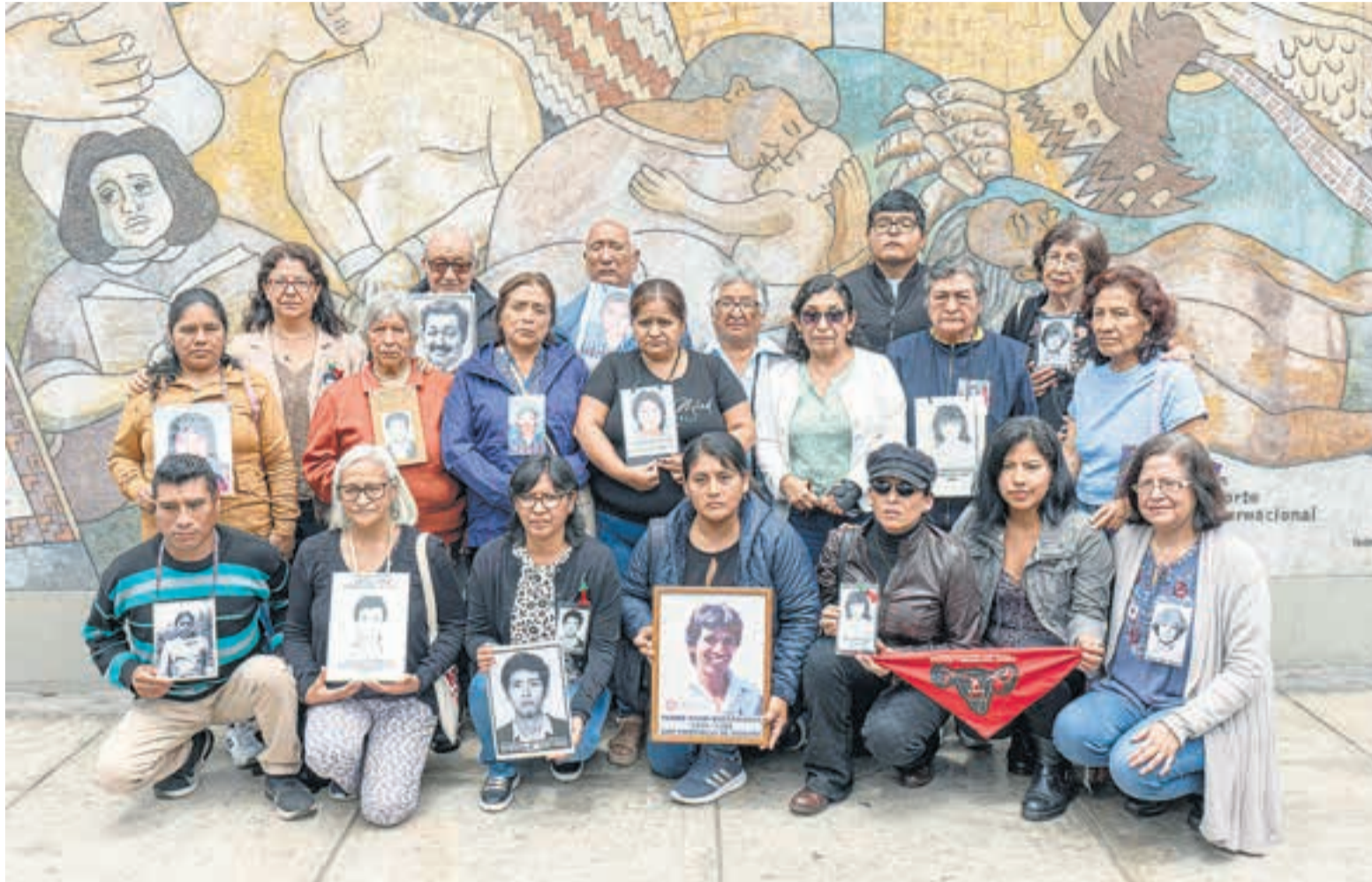
Familiares de los asesinados en La Cantuta y Barrios Altos seguirán adelante buscando justicia.

Parientes de víctimas de la dictadura peruana anunciaron movilizaciones y acciones en los tribunales internacionales. En esta nota de Página12 , varios testimonios.