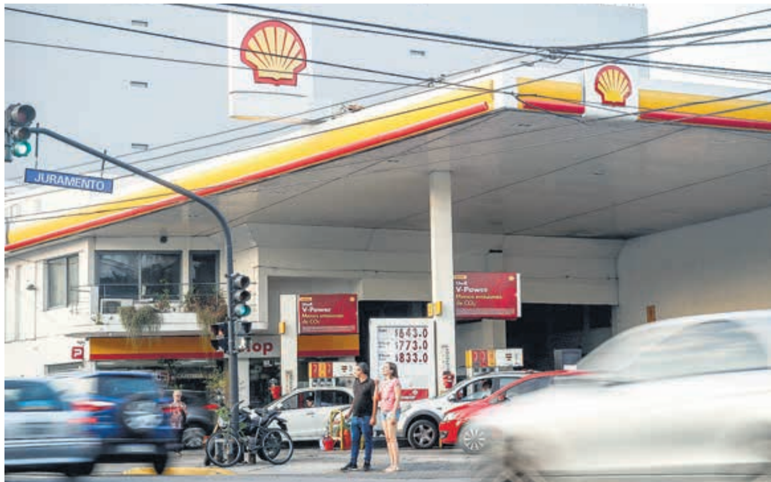
La petrolera Shell, la primera en marcar la línea de los aumentos.

Las naftas subieron 37 por ciento, el kilo de carne ya toca los 10 mil pesos, el colectivo se irá a 800 y las alimenticias cortaron las entregas mientras remarcan.