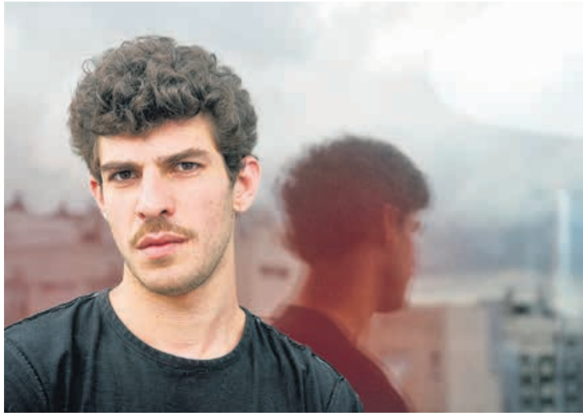
Lago tiene 33 años y actuará hoy en el Centro Cultural Richards.

El cantante refresca el género desde la utilización de un lunfardo actual y su intento de reflejar nuevos modos de relacionarse.