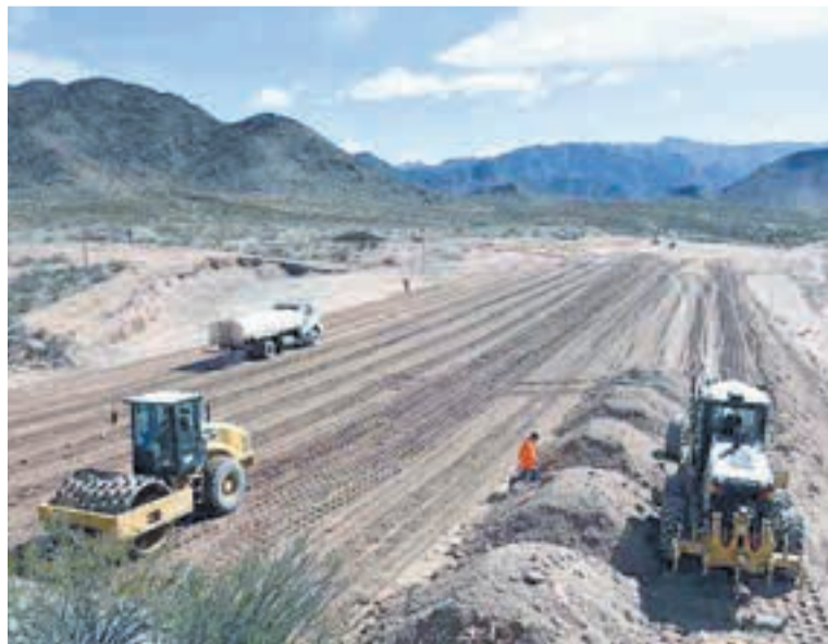
270 mil personas trabajan en obras públicas.

El bono actual (que rige para diciembre, enero y febrero) es de 50.000 pesos. Sin el bono, las jubilaciones mínimas serían de 105.713 pesos, monto que no llegaba a cubrir la Canasta Básica Total para que una persona no sea considerada pobre por el Indec para octubre, es decir sin contar el pico inflacionario de los meses que siguieron. “El bono de diciembre ya anunciado se está pagando con las jubilaciones de este mes”, aseguraron ante la consulta de Página 12 fuentes de Anses. El coordinador del Observatorio del Derecho Social en el Instituto de Estudios y Formación de la CTA Luis Campos aseguró que en los últimos años el haber mínimo jubilatorio cayó en términos reales un 44,3 por ciento (sin contar los bonos), en gran medida porque la fórmula de actualización corre de atrás a la inflación. “¿Por qué modificarla justo ahora? Para darles un saque más y que ni se les ocurra subir”.