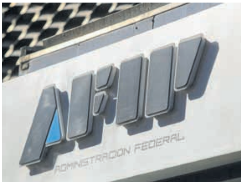
Otro impacto del plan Motosierra sobre los salarios devaluados.

Ayer, cuando en conferencia de prensa le preguntaron al vocero presidencial, Manuel Adorni, si se evaluaban medidas complementarias para mejorar el poder adquisitivo de los trabajadores y evitar la caída de los ingresos por el mega ajuste anunciado por Caputo, el flamante funcionario se desentendió del problema: "No entiendo