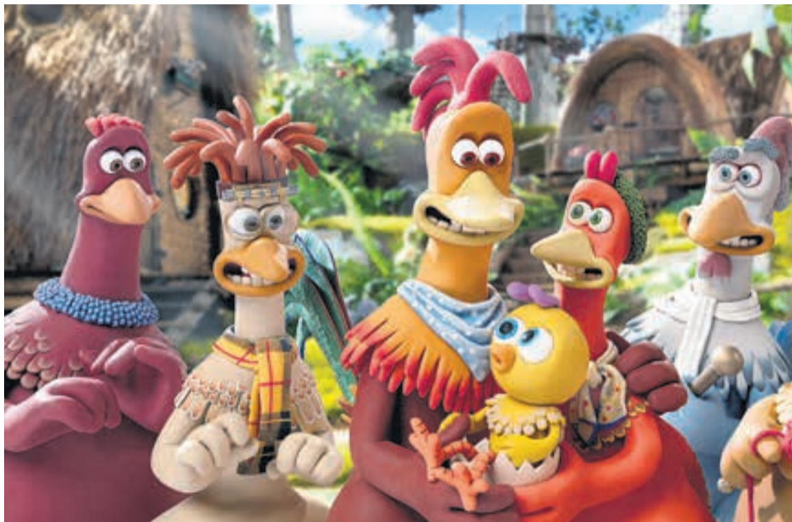
Un relato relativamente efectivo pero rutinario. Se la podrá ver en Netflix.

La secuela está varios escalones por debajo de la original, que la supera en gracia y originalidad. El tratamiento visual la acerca al mainstream animado del siglo XXI.