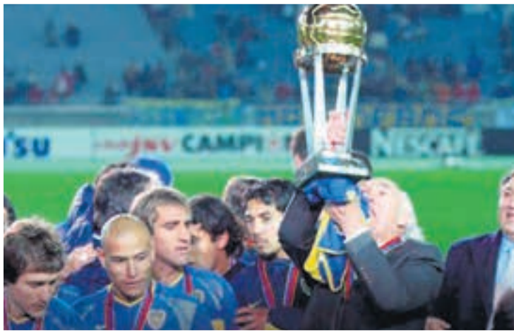
El Virrey levanta la Copa en Japón.

donde el Pato Abbondanzieri se lució con dos atajadas: el primero a Pirlo y el cuarto a Costacurta; Seedorf había fallado el tercero. En Boca convirtieron Schiavi, Donnet y Cascini; mientras que Dida le atajó el segundo a Battaglia.