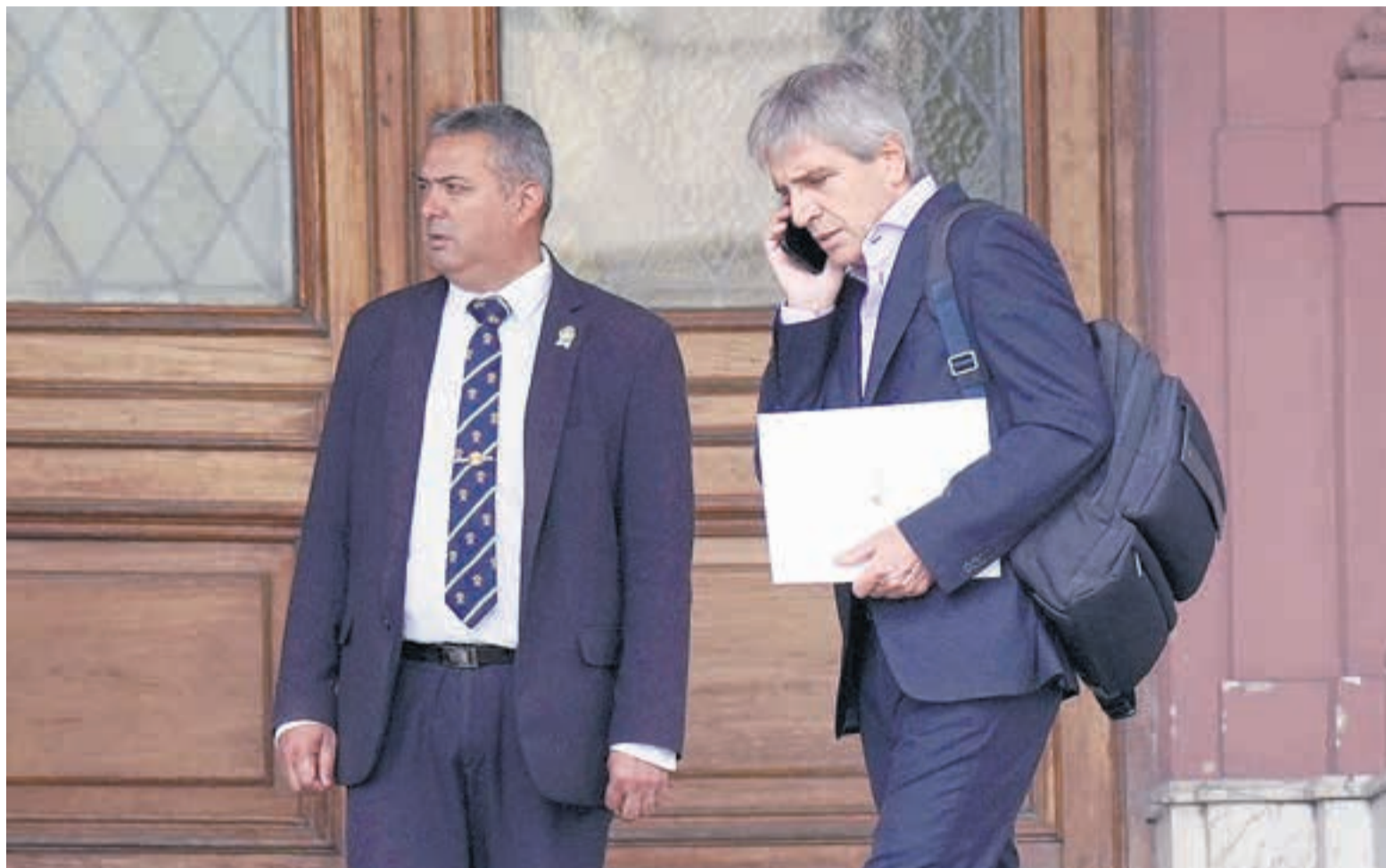
“La gente entendió que la génesis del problema es el déficit fiscal”, aseguró el ministro.

El ministro contó cómo serán los ajustes de tarifas en luz y gas. Buscarán “acordar” la eliminación de Ganancias sobre los salarios. Anticipó el fin de la fórmula de movilidad jubilatoria.