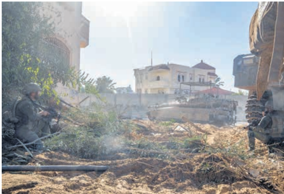
Tropas israelíes continúan su avance en la Franja de Gaza.

Atacaron ayer a unos 250 objetivos de Hamas. El Ministerio de Salud gazatí denunció que dispararon a pacientes de un hospital.