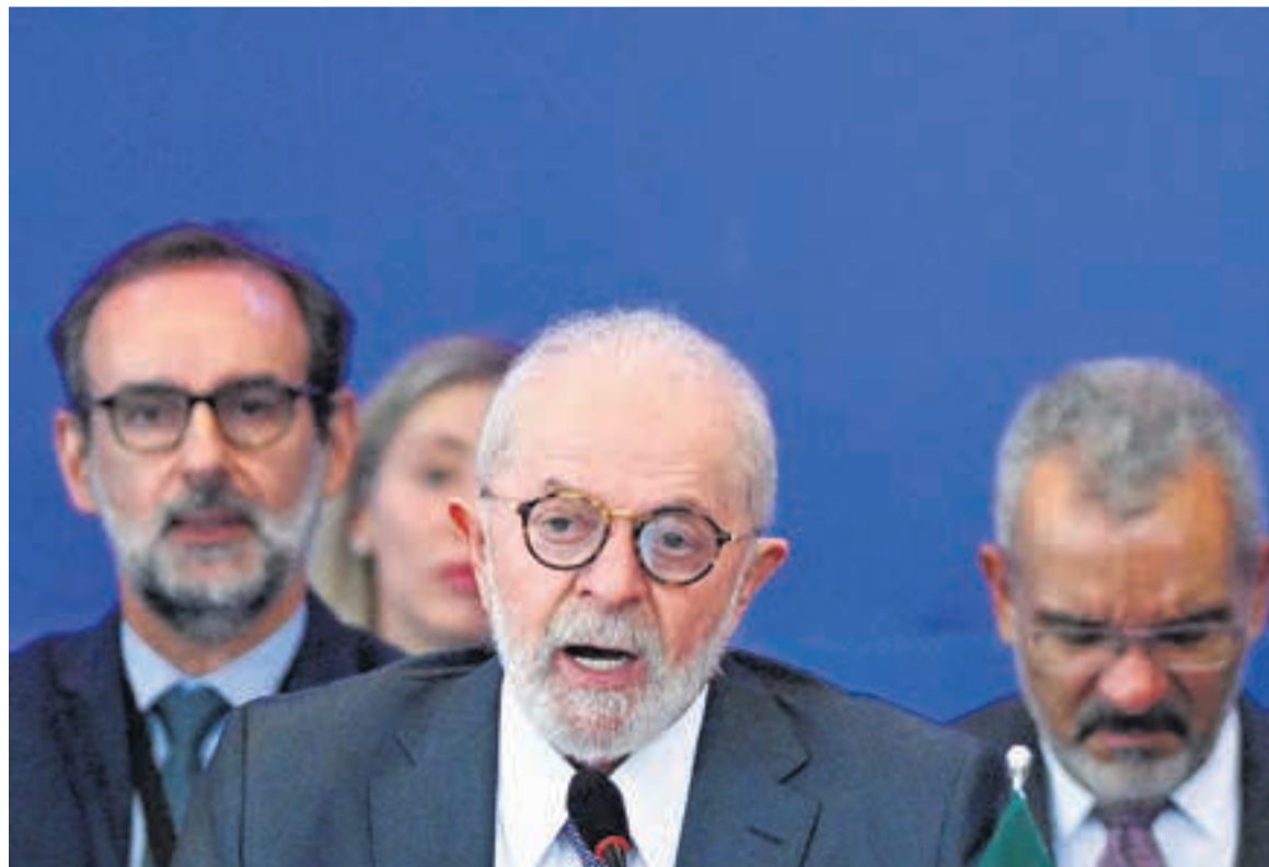
Lula da Silva promulgó una ley que cobrará impuestos a las empresas offshore.

Con esta nueva ley, el gobierno del líder petista pretende recaudar el equivalente a 6.000 millones de dólares hasta 2025.