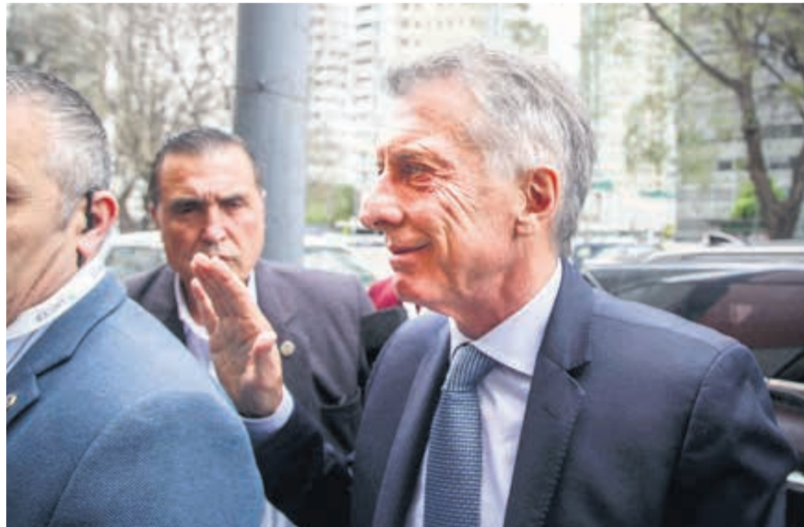
Mauricio Macri les pagó el desayuno a sus diputados.

El expresidente coordinó con los diputados de su partido la estrategia para bancar el paquete de leyes del plan motosierra. Bullrich y Larreta pegaron el faltazo.