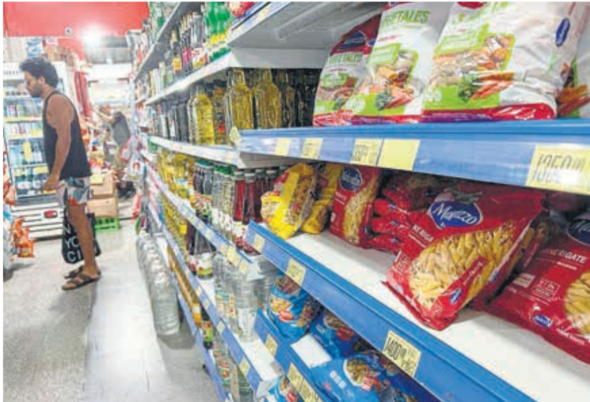
En mes pasado, los fideos subieron casi un 50 por ciento.

Con las expectativas lanzadas a causa de la anunciada devaluación, la segunda parte de noviembre fue una carrera de remarcación.