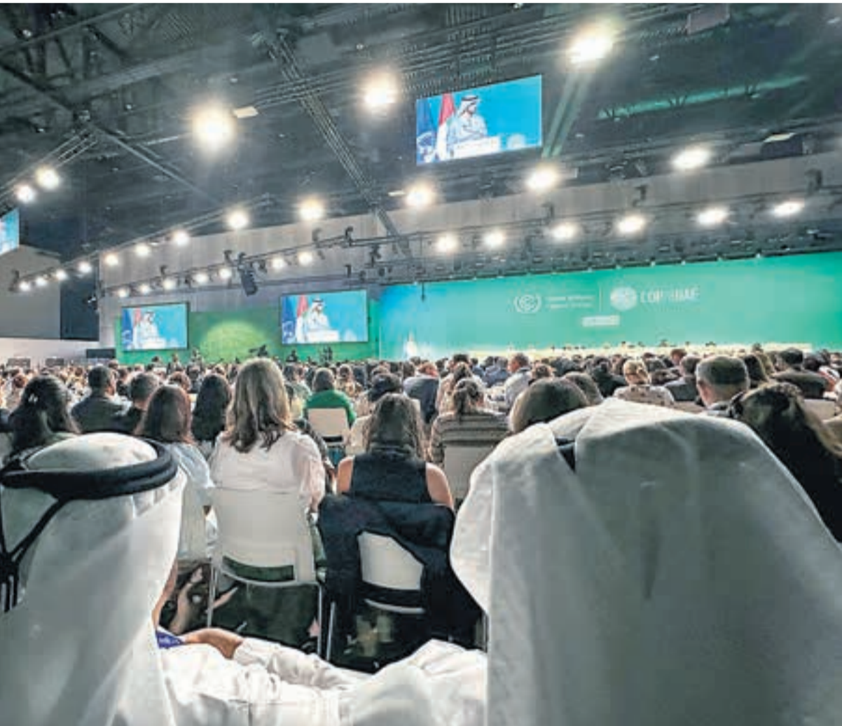
El documento final fue aprobado por unanimidad.

Con un acuerdo sin precedentes para el abandono gradual de los combustibles fósiles y los compromisos de las potencias y los vacíos legales.