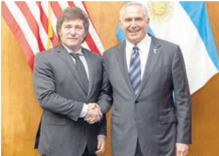
Javier Milei y el embajador de EE.UU., Marc Stanley.

El Consejo de Seguridad Nacional “es el foro principal del presidente (de los Estados Unidos) para la toma de decisiones sobre la seguridad nacional y la política externa”. La presencia en la Casa Rosada de funcionarios estadouni-