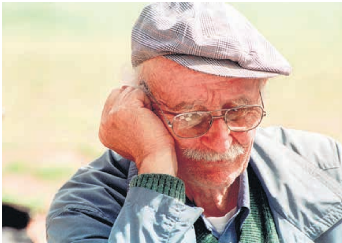
El sistema previsional está en el ojo de los ajustes del FMI.

Quieren suspender la actualización trimestral y que los aumentos de jubilaciones queden a discreción del Poder Ejecutivo.