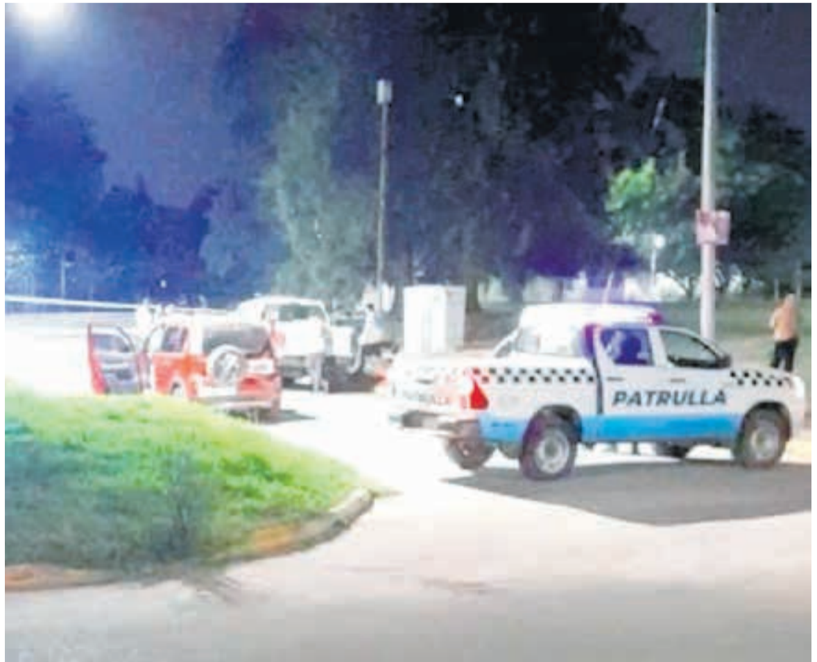
El joven habría actuado bajo la influencia de un brote psicótico.