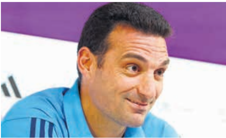
El entrenador Lionel Scaloni.

insistió en que “en todos los procesos hay momentos para parar la pelota, pensar, marcar metas y reflexionar sobre los compromisos que vienen”. “Por eso ahora que vine a Madrid (vive en Mallorca), aprovecharé para conversar con Rodrigo De Paul y Nahuel Molina sobre todo esto”, avisó.