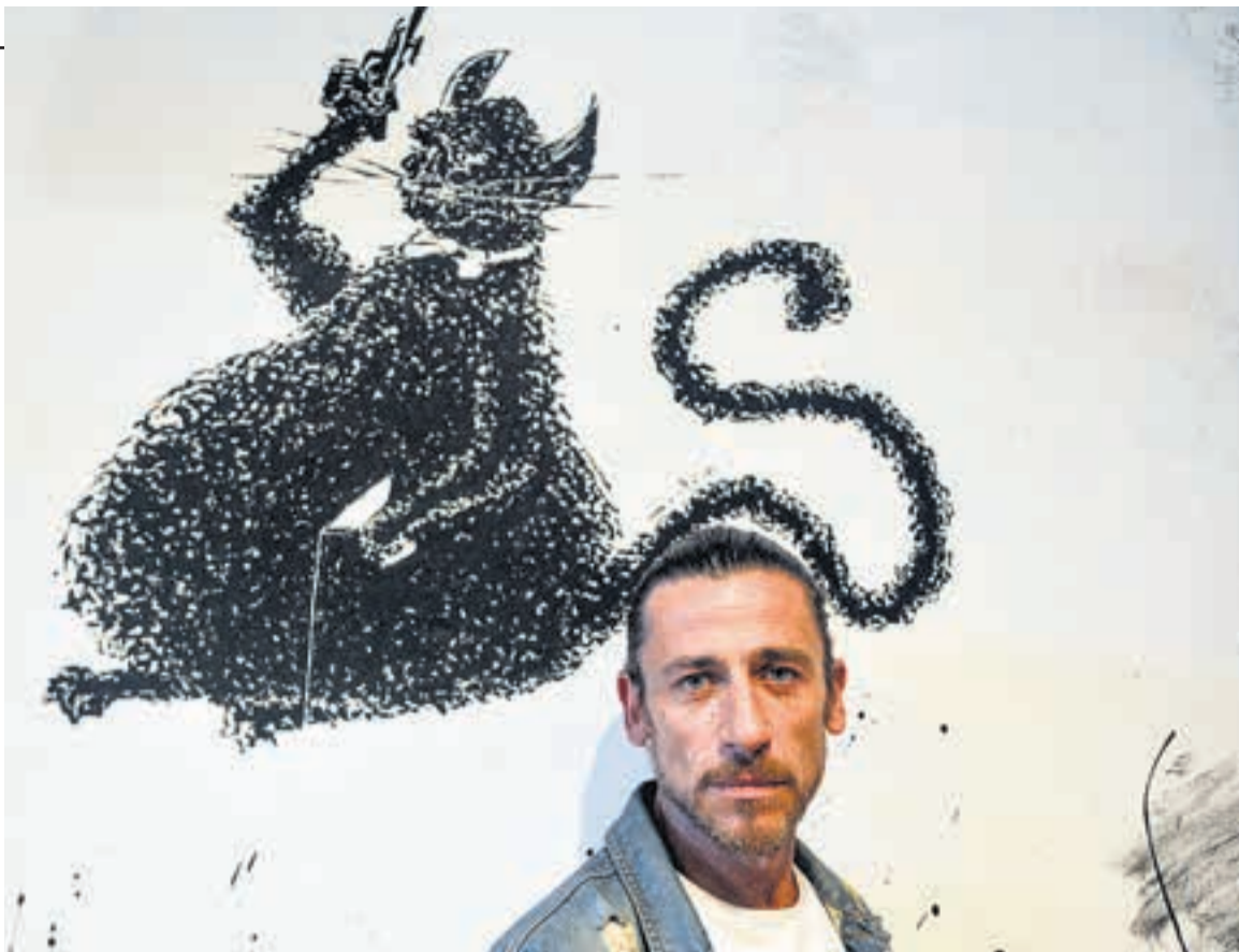
“Me parece positivo que estas historias dejen cosas picando para pensar, repensar, indagar.”

—Sí, porque lamentablemente estamos pasando un momento en el que no se deja de hablar de 2001 como un punto de referencia. Y es algo que nos asusta, nos angustia. Pero también hace varios años que estamos con este fantasma encima. Me acuerdo que cuando empecé a conversar con el director sobre esta película (él está radicado en Alemania), yo le decía: “No sé qué te pasa a vos, pero esta película en este momento, acá, resuena por todos lados”. Ahí sí yo sentía una responsabilidad fuerte. Lo mismo nos pasaba en Diciembre de 2001 . Son situaciones flasheras porque estamos hablando de esto que sucedió hace treinta años y lo sentimos tan cerca, y con una latencia del peligro