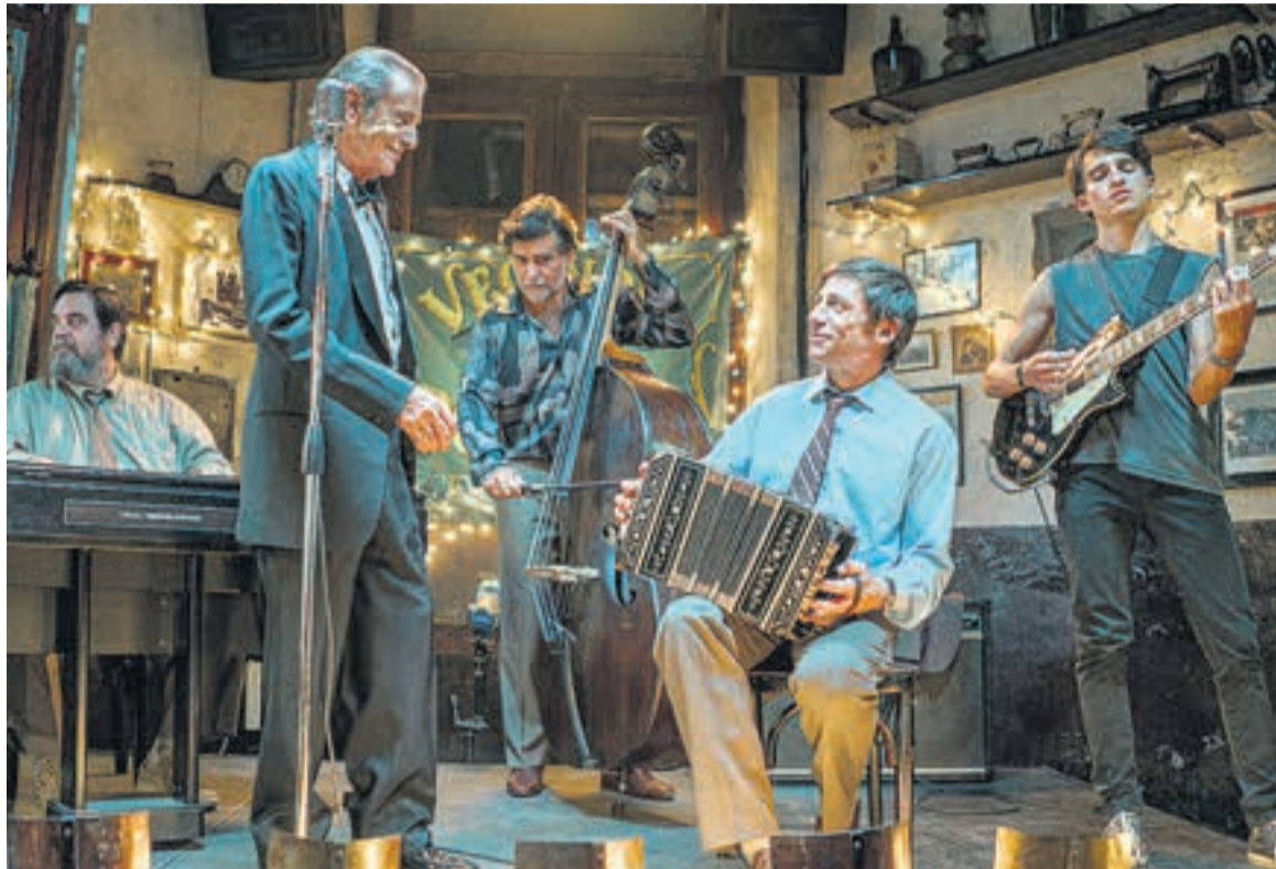
Chau Buenos Aires , retrato de una crisis recurrente en Argentina.

De la ficcionalización del encuentro entre Juan Manuel de Rosas y Charles Darwin a la brutal realidad de 2001, el actor disfruta los desafíos con una vocación inquebrantable.