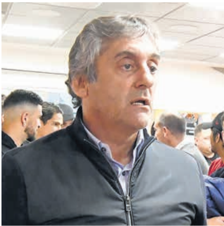
Enzo Francescoli salió a respaldar a Martín Demichelis.

Durante la entrevista, Francescoli matizó los problemas que atravesó el equipo a lo largo de la temporada y minimizó el impacto de la caída ante Central