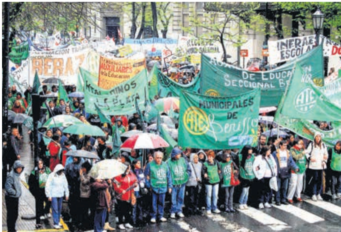
Al igual que ATE, las dos CTA rechazaron las medidas y Godoy llamó a resistir el ajuste.

ATE definió las medidas de “extorsivas” y denunció que la baja de contratos dejaría a miles en la calle. Reunión con Francos.