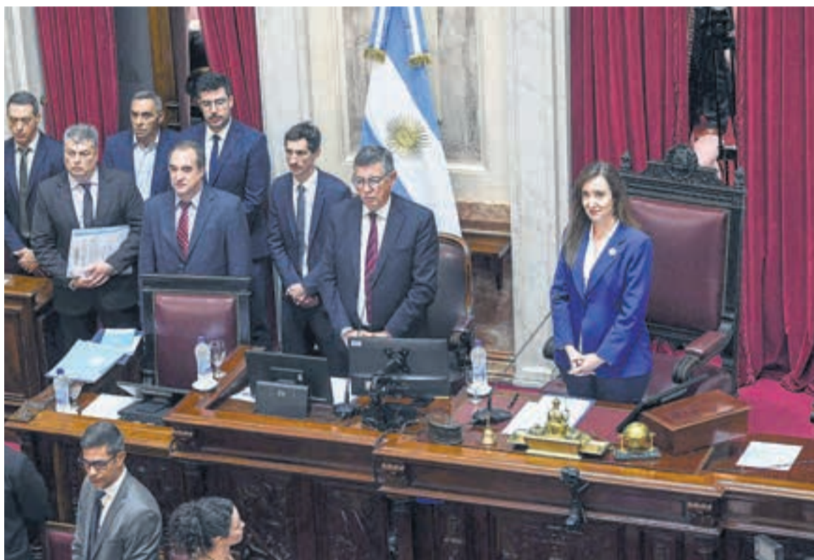
Victoria Villarruel impuso su voluntad en la Cámara alta, pero le costó caro.

“Se está conformando este nuevo oficialismo integrado por todos estos minibloques y alianzas para aprobar el feroz ajuste del gobierno”, advirtió la riojana Florencia