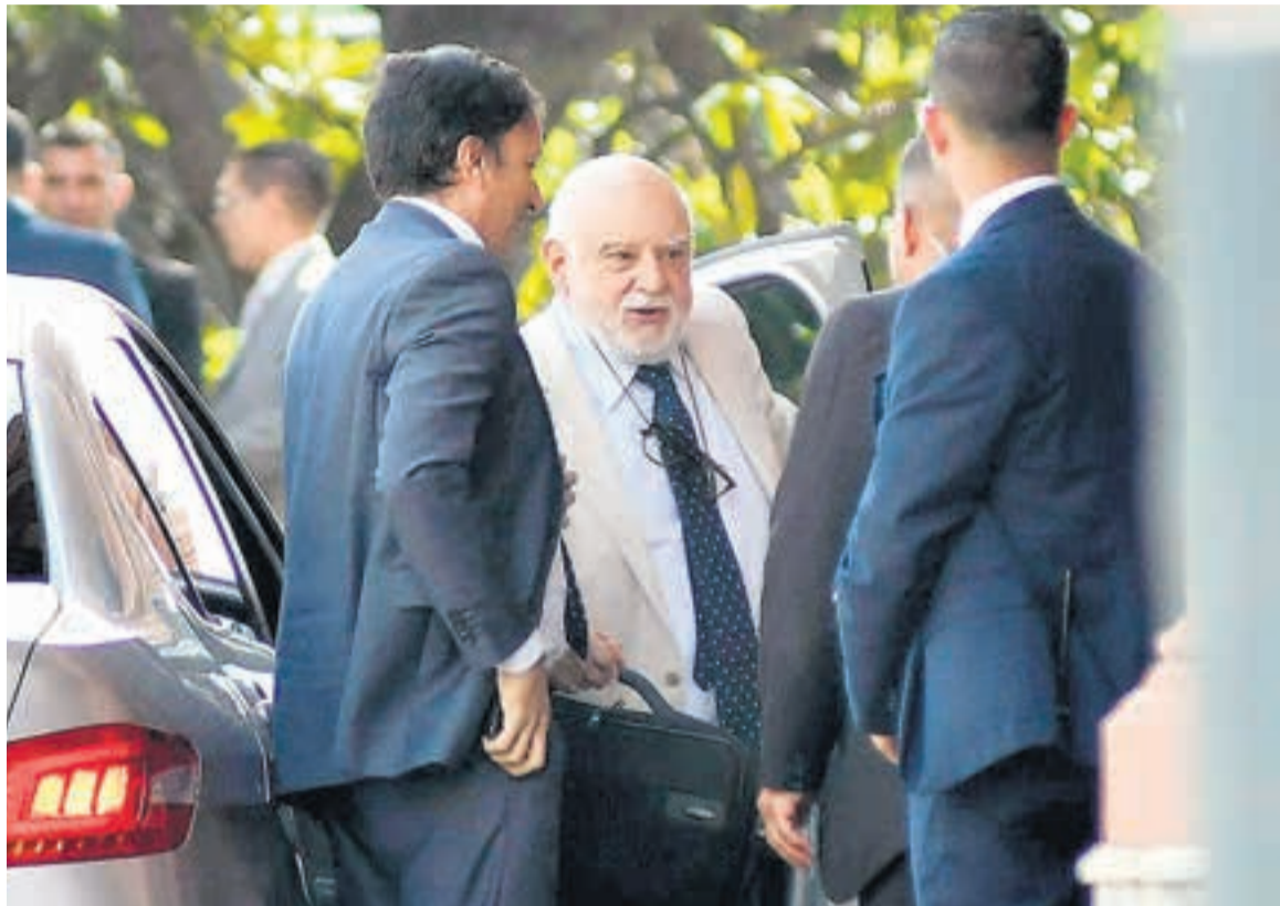
Barra, exfuncionario menemista, fue clave en las privatizaciones de los años 90.

Para poder designar al exjefe de la Corte, Milei modificó por decreto una ley. Las causas donde deberá intervenir Barra.