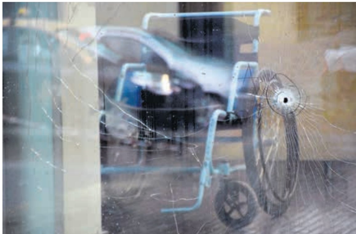
Las huellas del ataque al hospital Clemente Álvarez.

Las autoridades, provinciales y nacionales, dicen que los ataques son una reacción a las medidas de traslados de presos y endurecimiento de las condiciones de encierro.