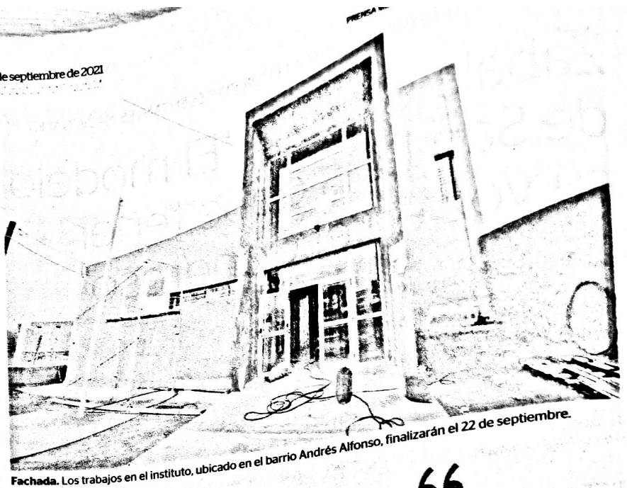
Fachada. Los trabajos en el instituto, ubicado en el barrio Andrés Alfonso, finalizarán el 22 de septiembre.

La obra ya tiene un avance cercano al 95%. Por ahora, la institución funciona en la sede del antiguo hospital, que está en condiciones precarias.